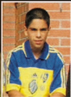
Foto aus dem FCL-Juniorenheft der Saison 2005/06