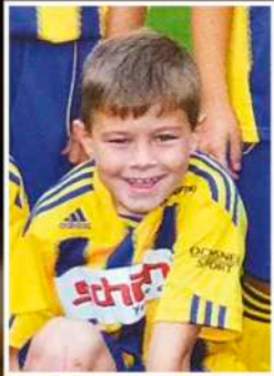
Foto aus dem FCL-Juniorenheft Saison 2010/11