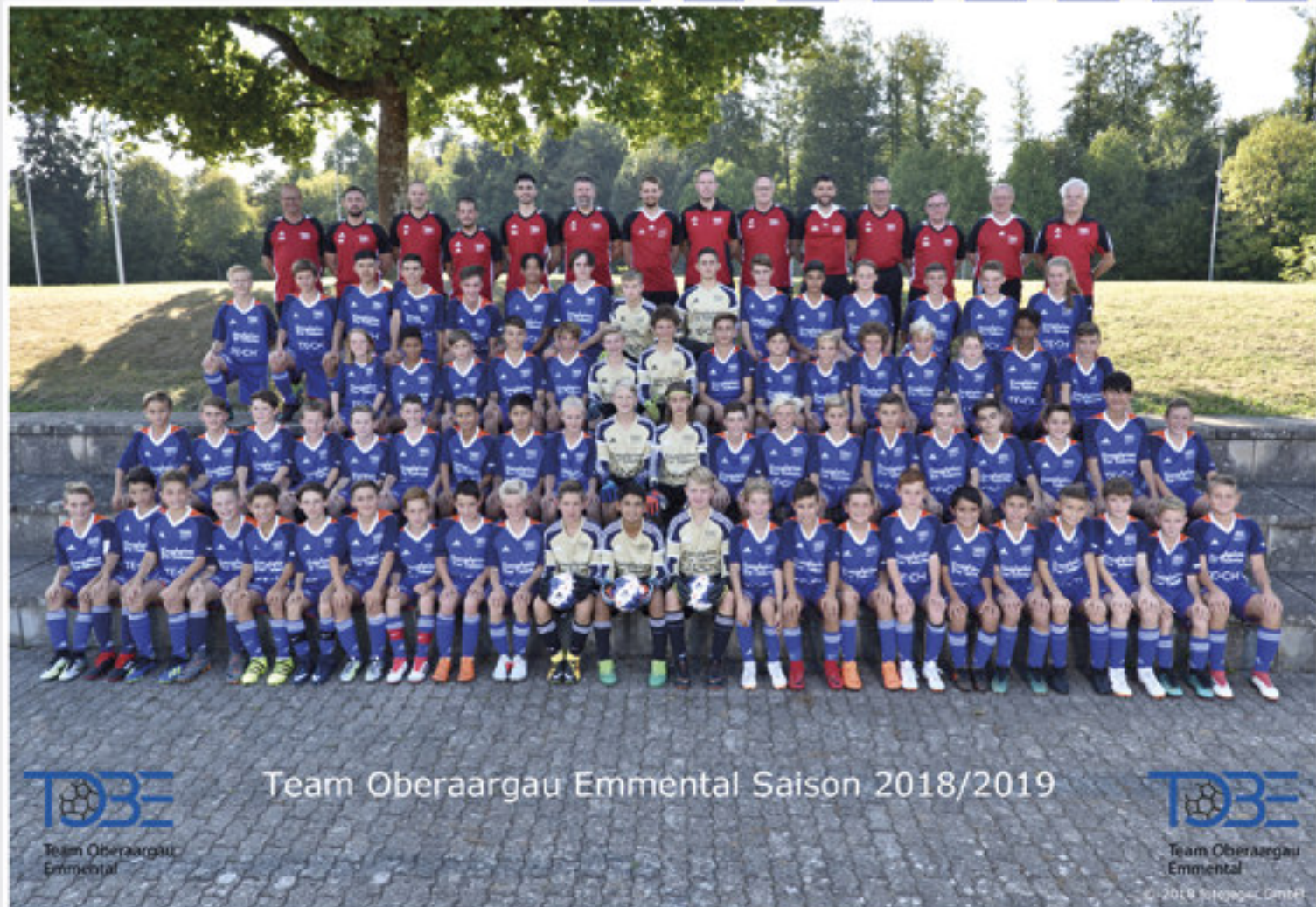
Team Oberaargau Emmental Saison 2018/2019