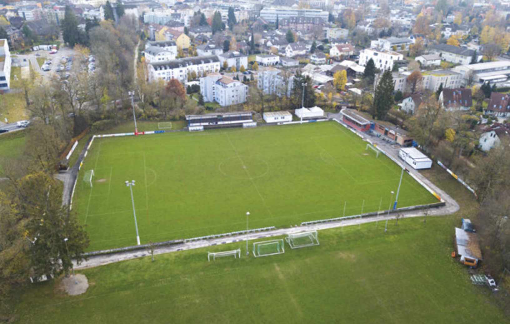
Stadion Rankmatte Langenthal 14. November 2017